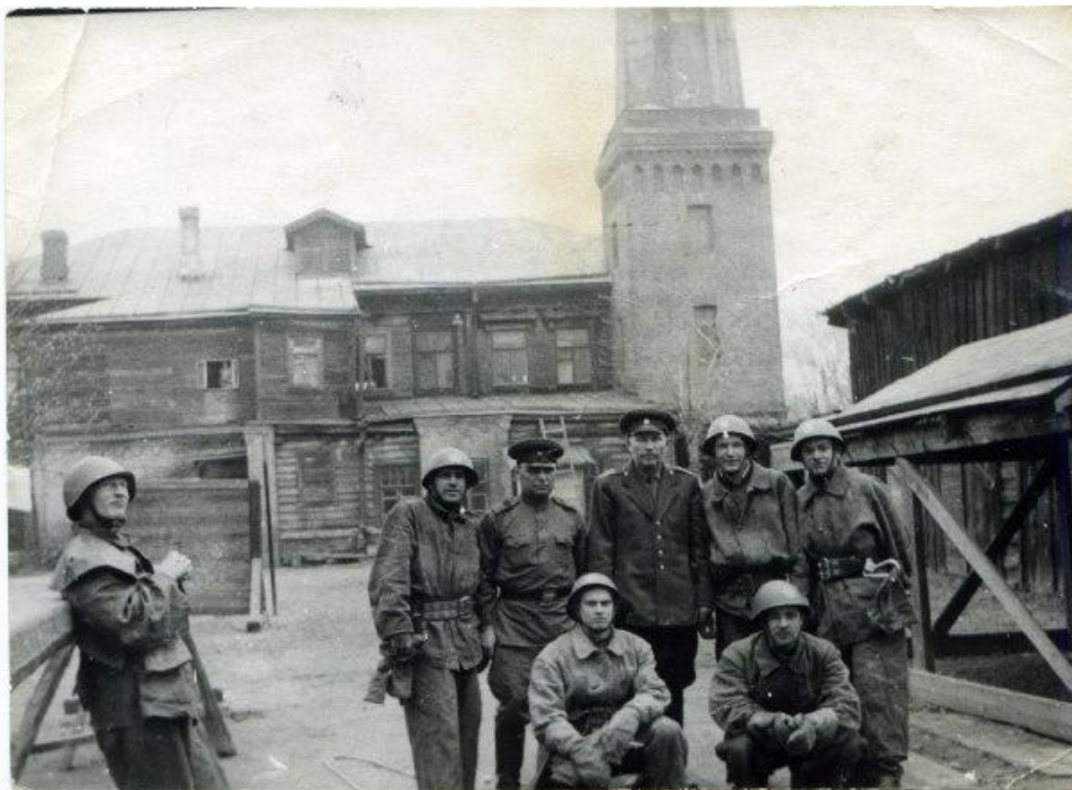
Более сорока лет дед (на снимке - в центре) отдал службе в пожарной охране, 1960-е