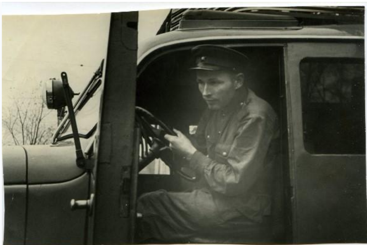
Машины дед водил мастерски, 1950-е

Впрочем, «тылом» прифронтовую Москву конца 1941 – начала 1942 гг. можно было назвать лишь условно. Бои на ближних подступах (по одним данным, немецкие бронетранспортеры и мотоциклы прорывались до Химкинского моста, по другим – до Сокола), обстрелы (до нашего контрнаступления) вражеской дальнобойной артиллерией московских пригородов, нескончаемые налеты фашистской авиации... Особенно страдал город от налетов. Взбешенный поражением Вермахта в наземном сражении за Москву фюрер приказал стервятникам Геринга «сжечь большевистскую столицу с воздуха». К тому времени немцы убедились, что мелкие зажигательные бомбы и возникающие от них пожары быстро ликвидируются самим населением, поэтому стали использовать фугасы и комбинированные бомбы больших калибров. Это значительно осложняло работу пожарных. Часть, куда получил назначение дед, находилась в Черкизове. Выезды на место пожаров следовали и днем, и ночью. Тушили жилые дома и административные здания, госпитали и школы, нередко – под продолжающейся бомбежкой.